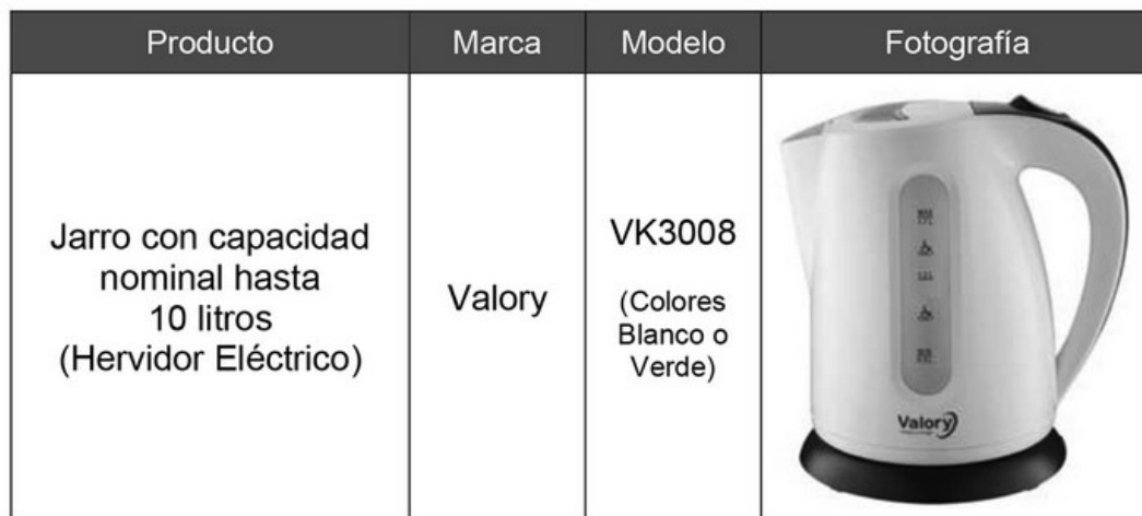
Tabla N° 1

2.- En carta de Ant. 5, la empresa Acetogen Gas Chile S.A. solicitó a esta Superintendencia alzamiento de la prohibición transitoria del oficio circular N°