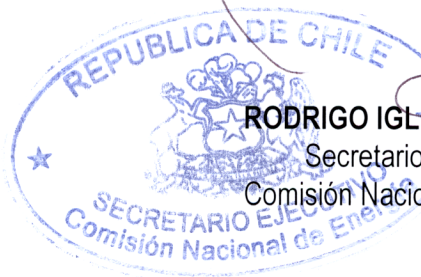
RODRIGO IGLESIAS ACUÑA Secretario Ejecutivo Comisión Nacional de Energía