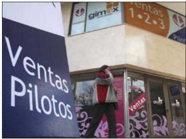
El gremio de la Construcción pidió que la promesa de compra antes del 1 de noviembre bastara para que los propietarios conservaran los beneficios.