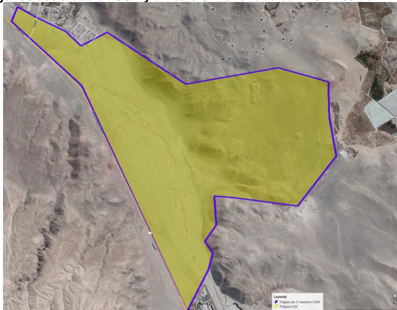
Figura 1: Polígonos declarado en SCR y artículo 5° transitorio del D.S. N°88 del PMGD Las Chilcas

Luego, con fecha 13 de septiembre de 2021, Concorde Solar SpA solicita formalmente a CGE S.A. realizar la reducción del polígono del PMGD Las Chilcas, considerando que la modificación corresponde solo a la reducción de la superficie utilizada para emplazar el proyecto, dentro del mismo predio informado anteriormente. Además, Concorde Solar SpA fundamenta su petición en que el PMGD Las Chilcas podría desarrollarse en un terreno de menor área al considerado inicialmente, tomando en cuenta aspectos de eficiencia, costo de arrendamiento y el costo de oportunidad para dicho elemento.