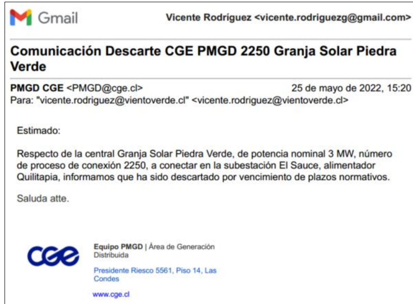
Figura 1: Comunicación de CGE S.A. respecto al descarte del ICC del PMGD Granja Solar Piedra Verde, de fecha 25 de mayo de 2022.

En respuesta a lo anterior, con fecha 30 de mayo de 2022, personal de la empresa Granja Solar Piedra Verde SpA señaló que conforme lo pactado en el contrato, el pago inicial, correspondiente al 40%, se devengará en el momento que solicite por escrito a CGE S.A. el inicio de las obras de adecuación, lo que a esa fecha no había ocurrido, hecho que es reforzado por el Reclamante en su presentación, conforme lo señalado en el Considerando 1° de la presente resolución.