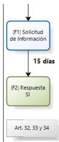
Figura 1: Extracto de Flujograma SEC

A continuación, se detallan 24 formularios, siendo el primero “SOLICITUD DE INFORMACIÓN”, que corresponde al procedimiento para aplicar los artículos 32, 33 y 34 del DS88, lo que se corrobora también en el flujograma de conexión publicado en el portal de vuestra Superintendencia: