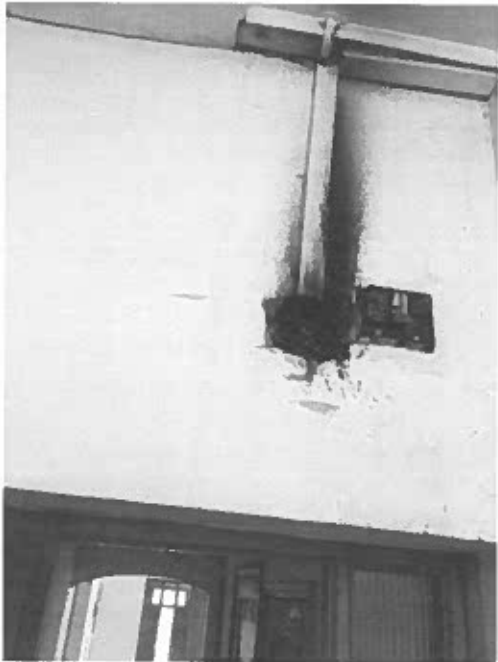
Figura N° 1: Fotografía en pasillo donde ocurrió amago de incendio.